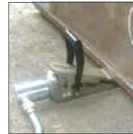
Kaldırma kaması Model HK-16T, 16 t