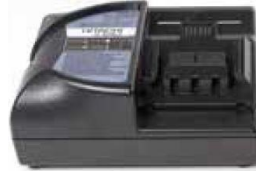
Hızlı şarj cihazı Model PYB- CHARG