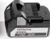
Akü Model PYB- BAT