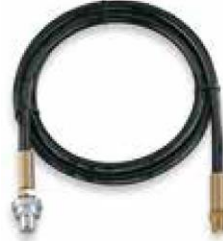
Hidrolik hortumlar Model HHC