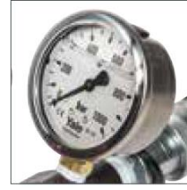
Manometre takımı opsiyonel ekipman Model GYA-63