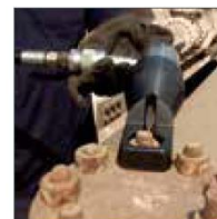
Dönmeyen paslanmış vidaları sökme anahtarları Model YNS/YNS-AH, SW 11 - 89 mm