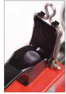
Tek elle işletim Ergonomik taşıyıcı içerisinde kumanda tuşları yer almaktadır.