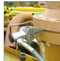
Ayırma kaması Model YSW-14T, 14 t

ND = alçak basınç kademesi (boş strok, yani yüksüz uzatma) HD = Yüksek basınç kademesi (yük stroku)